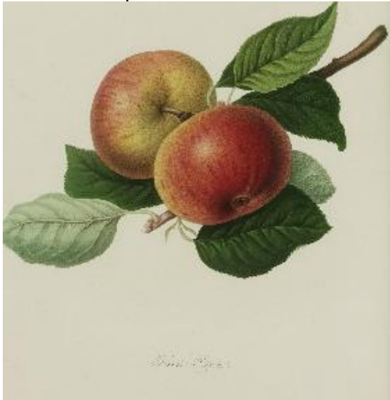
Pomona Londinensis 1818, William HOOKER.

EPIDERME : Jaune clair ou d'or, presque tout lavé et surtout fouetté de rose tendre sensiblement plus foncé à l'insolation. Lenticelles nombreuses, grosses, gris squameux.